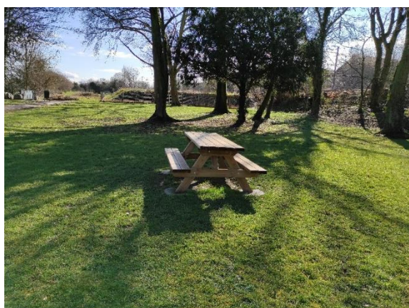
← Parc communal