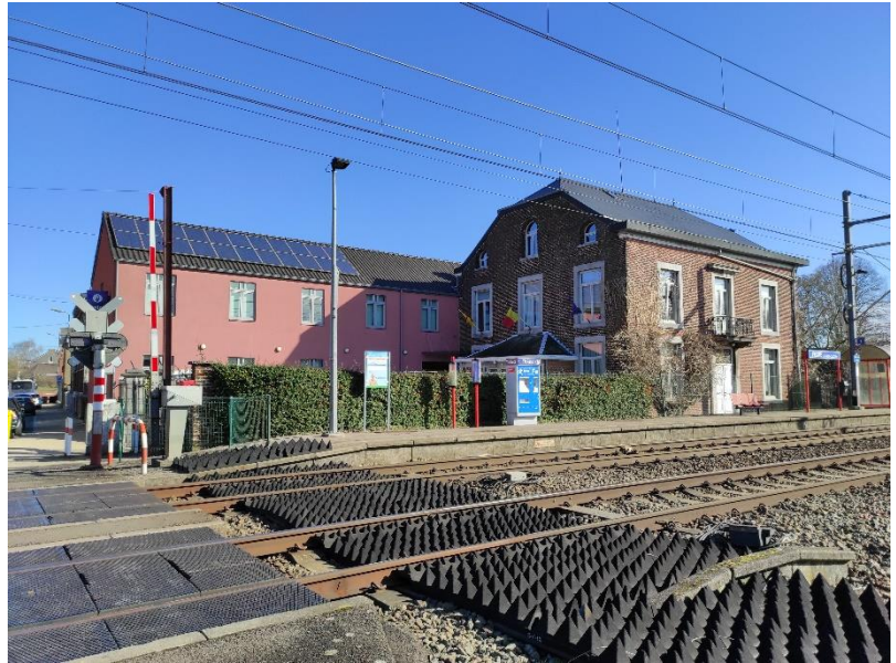
Gare de Fexhe