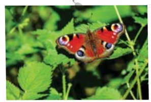
L'ortie est la plante hôte de la chenille du Paon du jour