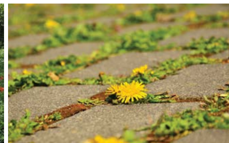
Gérer sa parcelle au naturel, c'est aussi accepter la présence de quelques « mauvaises herbes » !