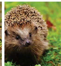
Les zones sauvages attirent les petits mammifères.