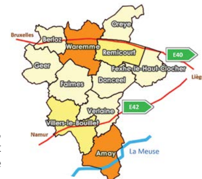
Carte du territoire du GAL « Jesuishesbignon.be ». Le dégradé de couleur indique le nombre d'habitants, plus la commune est foncée, plus elle est peuplée.

Nos priorités : développer une mobilité innovante, réduire les inondations, favoriser un environnement naturel riche et diversifié, améliorer la qualité de vie de nos aînés, encourager une agriculture durable, développer une économie locale, et favoriser la transition énergétique.