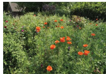
Une prairie fleurie du plus bel effet dans un jardin

DE GAUCHE À DROITE ET DE BAS EN HAUT : les solidages américains, la renouée du japon, le cotonéaster horizontal, la balsamine géante ou de l'Himalaya, les spirées, l'arbre à papillon, le lupin, le rhododendron, le rosier rugueux.