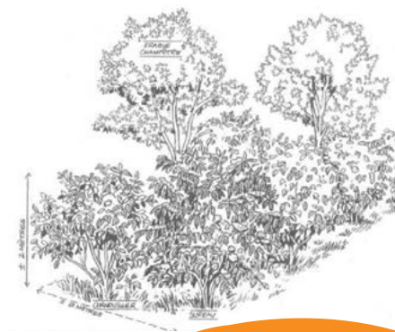
A gauche : La haie basse ; à droite : la haie libre (Direction Générale des Ressources Naturelles et de l'Environnement 1995).