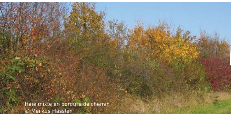
Haie mixte en bordure de chemin