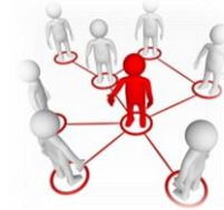
Travail en réseau